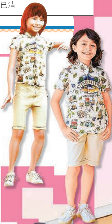
數碼人型上身效果同真人一樣合適。

城市是要進步、要發展，步伐向前的時候，總有些景觀會消失。這展覽正好讓大家緬懷一下老香港，感受昔日的風情，透過各展品中呈現的畫面，將眾人的集體回憶定格，以微縮藝術方式保留，每件作品也看得出是極具心思和誠意滿滿，除了吸引觀賞者的目光，還有一份共鳴呢。