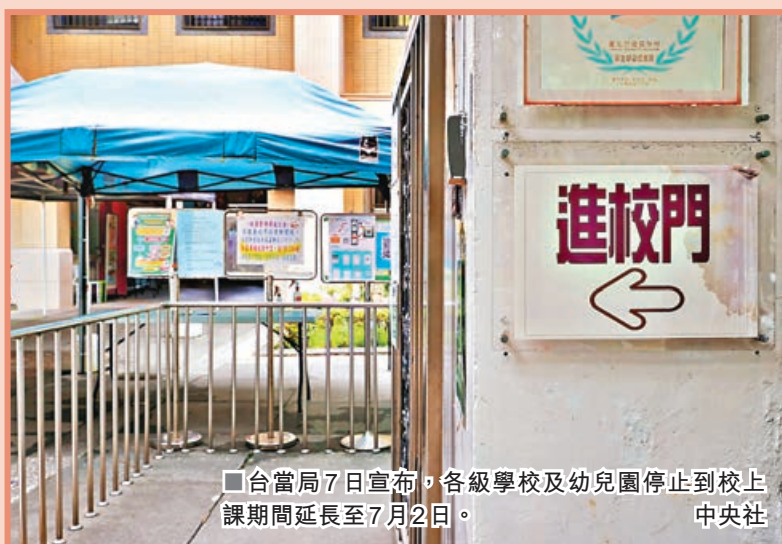
■台當局7日宣布，各級學校及幼兒園停止到校上課期間延長至7月2日。

台灣當局流行疫情指揮中心7日宣布，全台疫情三級警戒將延長至6月28日。當局教育事務主管部門也在同日宣布，各級學校及幼兒園停止到校上課期間延長至7月2日，大學指考（即高中生第二次能力測驗）延期至7月28日舉行。根據台灣教育主管部門的發布，4月20日至6月6日傍晚5時30分，島內確診學生合計430名，其中包括420例本土個案、10例輸入個案，其中又以大專院校確診最多，累計有153名學生確診。不少父母憂心兒女的學業可能受到影響，且目前當局提供的唯一疫苗阿斯利康並不適合大部分學生注射，未來若疫情反覆，孩子們的學習和健康如何保證？