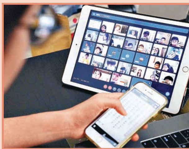
■因家中沒有WiFi，線上教學對於一些台灣學生來講存在困難。中央社