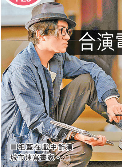
祖藍在戲中飾演城市速寫畫家。