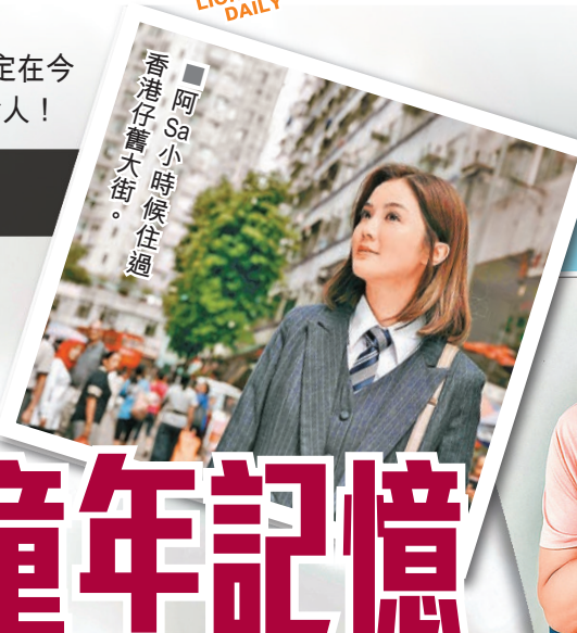
阿Sa小時候住過香港仔舊大街。