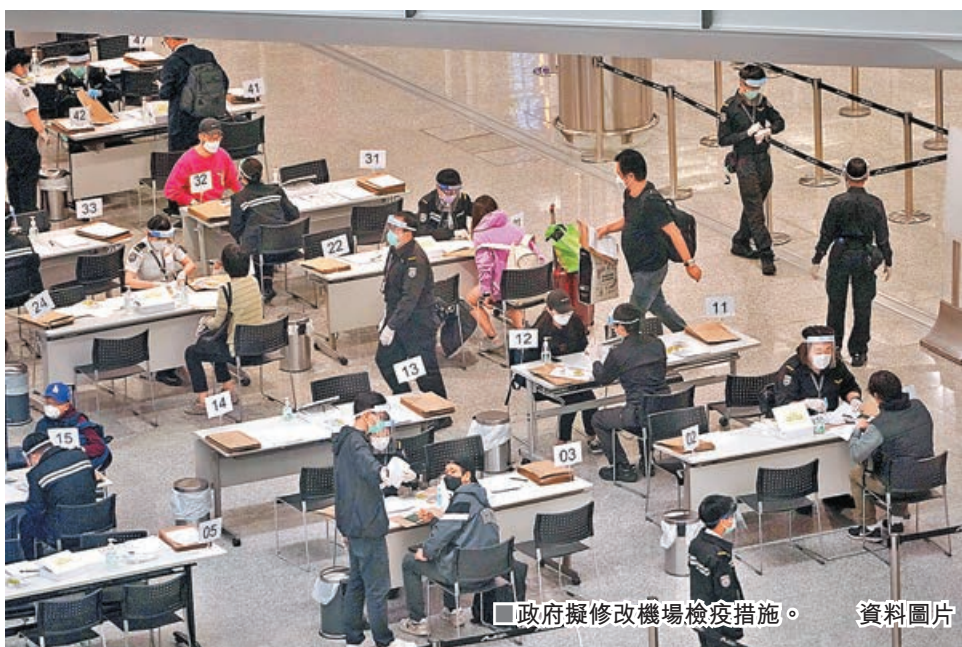
政府擬修改機場檢疫措施。

香港昨日新增4宗輸入的新冠肺炎確診個案，分別來自黎巴嫩、斯里蘭卡、印尼、奧地利，其中一人帶有N501Y變種病毒，無新增本地病例。對早前有變種病毒疑「走漏」輸入本地社區，政府正研究為外來或檢疫人士作病毒抗體檢測，衛生防護中心轄下兩個科學委員會昨日更建議，若來自非高風險地區的海外入境人士完成接種兩劑疫苗逾14天、核酸檢測結果呈陰性，再測試抗體後，若有抗體者，檢疫期可縮短至7天。