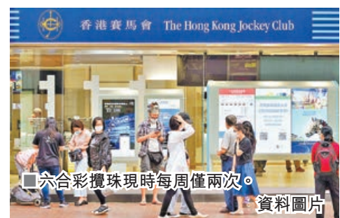
六合彩攪珠現時每周僅兩次。 資料圖片

另外，食物環境衛生署公布，「疫苗氣泡」原則下C類及D類運作模式的餐飲處所名單中，有627間C類餐廳堂食至午夜12時、4間D類食肆堂食至凌晨2時。市民可掃「疫苗氣泡」二維碼了解有關名單。