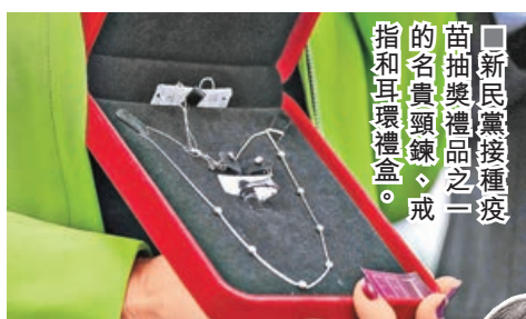
新民黨接種疫苗抽獎禮品之一，名貴名錶、戒指和耳環禮盒。

新民黨捐出價值超過100萬元獎品，供已接種疫苗的市民抽獎，當中包括由主席葉劉淑儀捐出的古董名錶一隻，以及其他成員捐出的1萬元購物券、鑽石、手提電腦、手機、武夷山大紅袍5斤等。