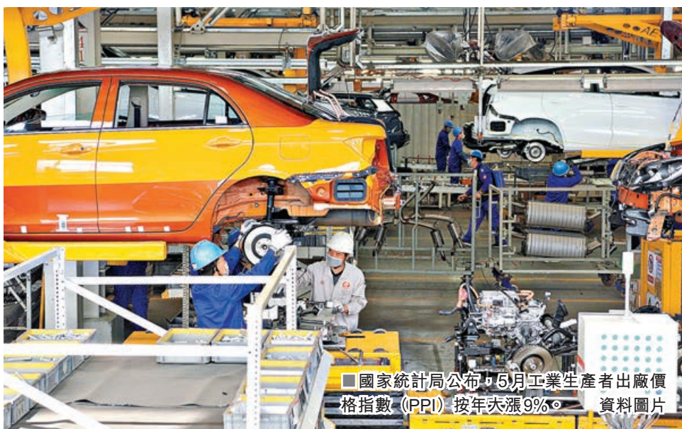
■國家統計局公布，5月工業生產者出廠價格指數（PPI）按年大漲9%。資料圖片

國家統計局9日發布最新數據顯示，5月內地豬肉等食品價格超預期下降，導致當月居民消費價格指數（CPI）按年漲幅低於預期，但1.3%的漲幅仍創8個月高點，連續3個月正增長且漲幅持續擴大。與此同時，國際大宗商品大幅漲價推動國內工業品價格繼續上行，5月工業生產者出廠價格指數（PPI）按年大漲9%，為2008年10月以來最高。