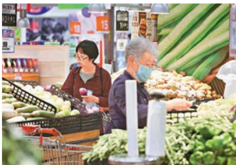
■5月中國居民消費價格指數（CPI）同比上漲1.3%。

5月按年漲幅擴大，食品價格由4月的按年下降0.7%轉為上漲0.3%，豬肉價格按年下降23.8%，降幅擴大2.4個百分點，豬肉等食品價格按年大幅下降，部分抵消了魚、雞蛋等食品價格上漲，以及油價等服務價格上漲的影響。非食品價格是CPI上漲的主要驅動力。非食品中，飛機票、汽油和柴油價格按年漲幅均超過20%，顯示出行活動增加，教育文化和居住價格漲幅也有所擴大。