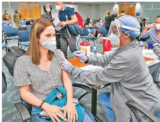
美國居民接種疫苗開始有下降狀況。

美國總統拜登目標下月 4 日國慶前為 70% 成年人接種新冠疫苗，但近日各州接種進度持續減慢，平均每日打針人數少於 100 萬人，其中以南部和中西部州份的減幅最為明顯，這或將影響拜登的接種目標。