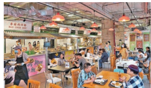
新加坡下周一起分兩階段放寬防疫措施。圖為當地的美食廣場。

小組同時宣布擴大疫苗接種計劃至 12 歲至 39 歲民眾，新加坡公民由今天起的兩周內可優先預約打針，之後會開放給該年齡組別所有人士。當局估計到 8 月將有 50% 人口完成接種，到 10 月將增至 75% 人口打完兩針。