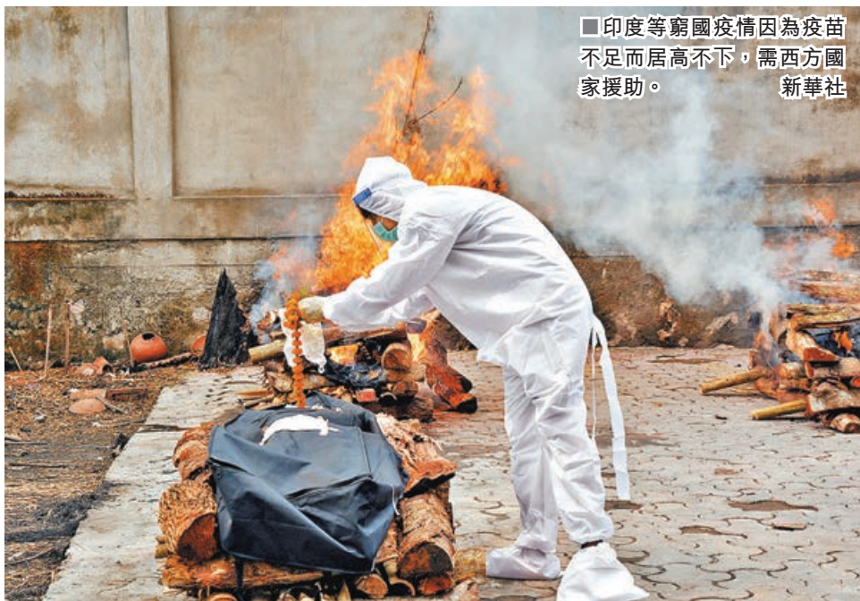
印度等窮國疫情因為疫苗不足而居高不下，需西方國家援助。

全球新冠疫苗分配極度不均，一眾發展中國家多番發聲，呼籲發達國家分享及協助供應疫苗，如今終於稍見曙光。據報在今日起舉行的七國集團（G7）峰會上，與會領袖將承諾在明年前共捐出最少 10 億劑疫苗，當中美國昨日率先宣布會購買 5 億劑輝瑞疫苗，在明年中之前分批捐給全球約 100 個中低收入國家。不過專家指出，全球各國起碼需要 110 億劑疫苗，才能達到有效群體保護，發達國家這次捐疫苗只是杯水車薪，必須提供更多協助，包括幫助發展中國家自行生產疫苗。