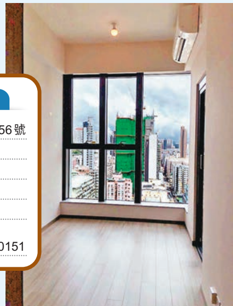
■ 單位客飯廳景觀開揚

地址 元州街342-356號 樓齡 今年4月入伙 單位 中層F室 實用面積 220呎 月租金額 11,500元 代理 中原地產 徐小姐 5929 0151