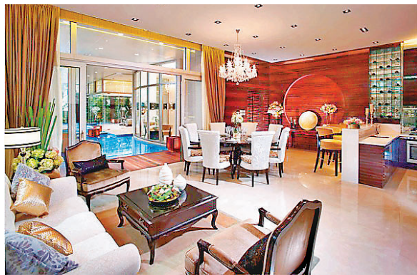
■ One Madison 豪華住戶會所。