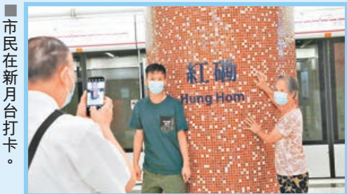
■市民在新月台打卡。