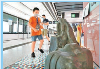
■新月台設有石雕藝術品。