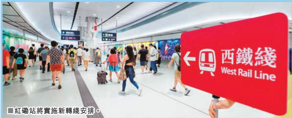
■紅磡站將實施新轉綫安排。