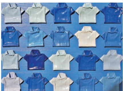
■摺衣服創作意念，是冥想期間滋生。