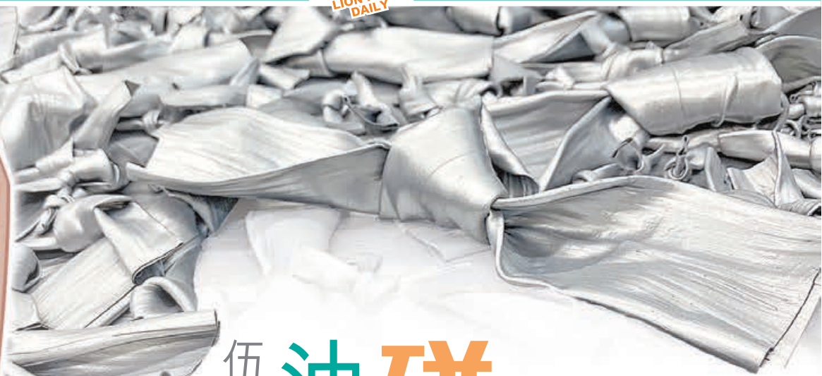
■摺疊顏料還可打結。

今次的展覽取名「眾色皆蒙福」(Every Colour is Blessed)，皆因他由粉紅色衫帶來的偏見引申至更深層次的社會問題。「可能是文化衝突或者歧視。」因此，藉着作品，他期望：「不同顏色的人種都受到祝福。」而層層疊起的不同顏色的衣服，在伍龍威看來，其意義可不止是一件普通衣服，而可把它們視作為一個影像。「每件衫都略有不同，好似在畫一個人，可能是一個家庭，或是人生延