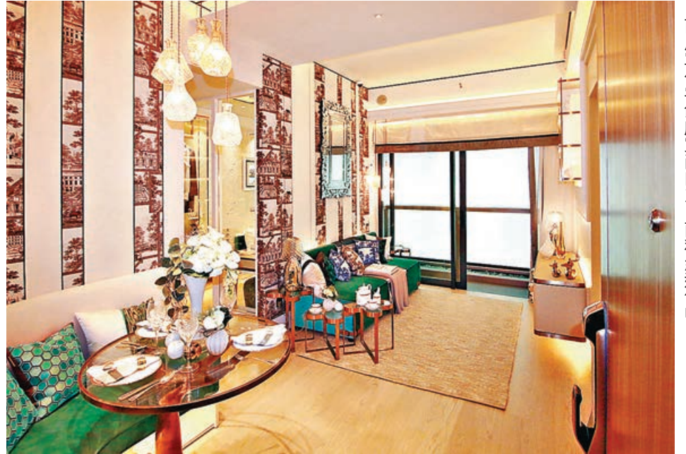
兩房單位客廳寬敞四正，面積約達150呎。