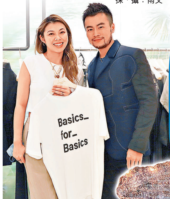
■ Something Ode 精選多個環保時裝品牌，如 Basics for Basics。