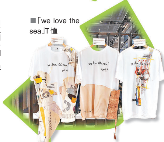
■ 「we love the sea」T恤