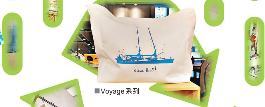
■ Voyage 系列