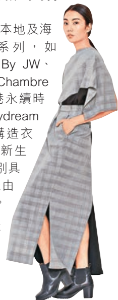
■ Something Ode x Tomorrow by Daydream Nation 時尚女裝，由男裝西褲解構而成。

同時，品牌亦與多個本地及海外時裝單位推出聯乘系列，如 Something Ode x Blind By JW、Something Ode x La Chambre Miniature 等，當中如香港永續時尚品牌 Tomorrow by Daydream Nation 擅長拆解及重新構造衣袖，利用創作賦予舊衣新生命，其聯乘帶來一系列別具一格的時尚女裝，均是由男裝西褲解構設計而成。