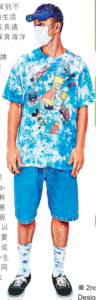
■ 2nd Closet Design

而從事時裝行業的 2nd Closet Design，品牌名稱皆有「第二個衣櫃」的意思，因衣服變成垃圾的問題愈趨嚴重，所以品牌理念其中一個主要元素就是把一些遺棄或過季的衣物重新給予生命，以街頭風格及不同有趣的二次創作手法打造更有價值的系列。