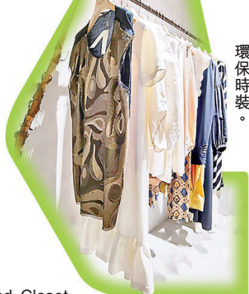
■ 陳列多個品牌環保時裝。