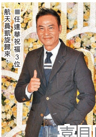
■任達華祝賀3位航天員凱旋歸來。

中國神舟十二號飛船早前成功發射升空，3位航天員聶海勝、劉伯明、湯洪波進駐中國太空站，在核心艙內生活。中國太空站是目前全球最新建造的太空站，標誌着中國的航天事業達到世界水平，是真正的中國人的驕傲！一班愛國藝人讚嘆祖國航天事業的成就，並覺與有榮焉！