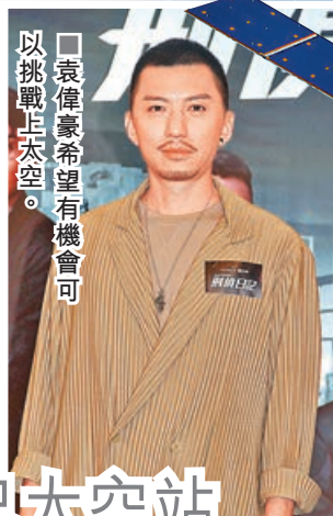
■袁偉豪希望有機會可以挑戰上太空。