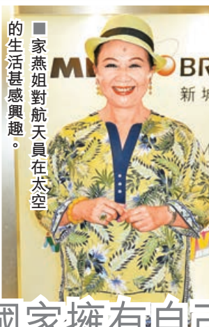
■家燕姐對航天員在太空的生活甚感興趣。