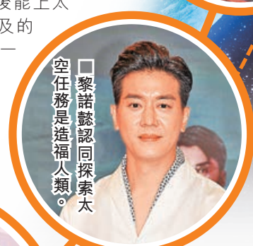
■黎諾懿認同探索太空任務是造福人類。