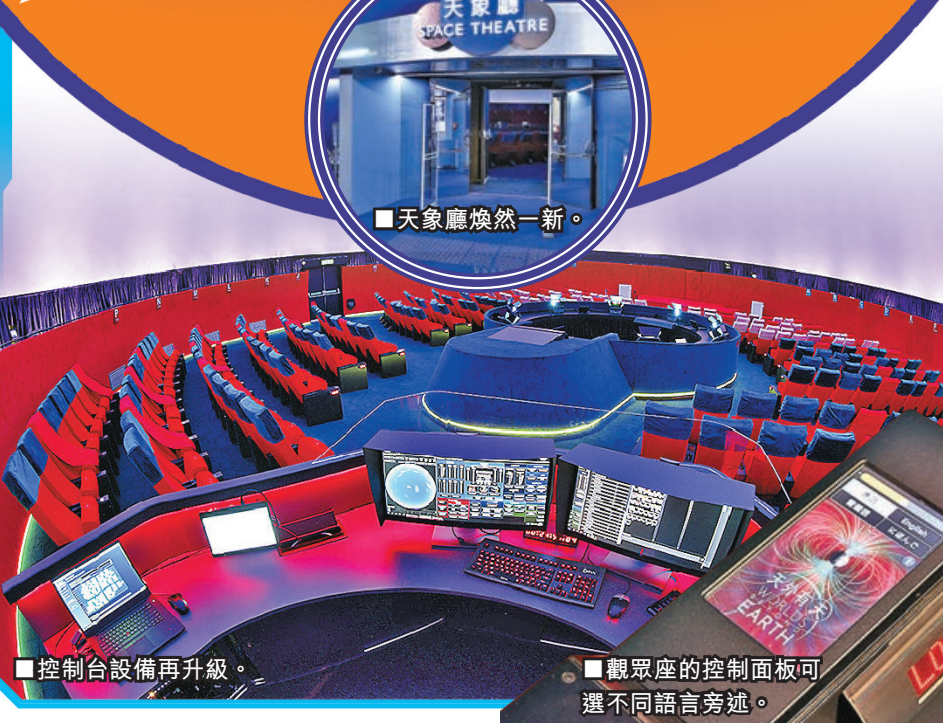
■控制台設備再升級。