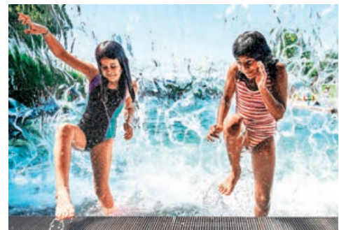
■ 華盛頓天氣炎熱，兩名女童在公園水池玩水消暑。