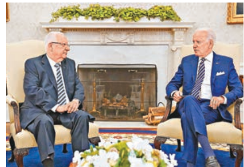
■ 拜登在白宮會晤以色列總理里夫林，談及伊朗問題。

美軍周日晚對敘利亞和伊拉克邊境地區多個親伊朗民兵組織的軍事設施發動空襲，指這些設施被用於襲擊駐伊拉克美軍。白宮發言人普薩基前日表示，拜登認為美軍這次空襲是「必須且合適」的行動，以保護該地區的美國人員、夥伴和盟友。