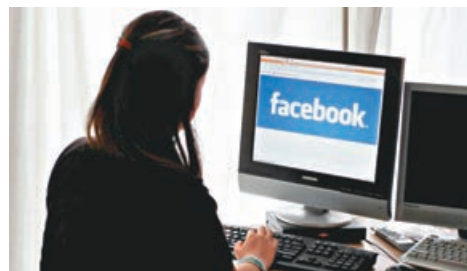
■ fb 在社會各階層都擁有大量用戶。 網上圖片

面性」對付科技巨頭的人士應引以為鑑。法院對聯邦政府的反壟斷指控通常採取較保守的態度，聯邦政府幾年前試圖阻止 AT&T 收購時代華納便在法庭上鎩羽而歸。