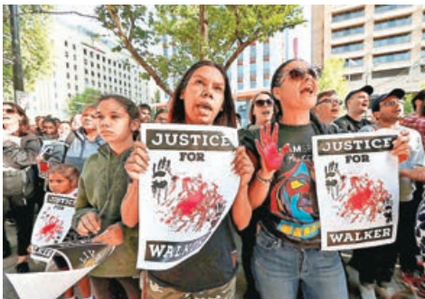
■ 澳洲原住民上街要求政府承認錯誤。

人類中心的殖民屠殺數據，及應用同一研究方式，整理出多項澳洲原住民被屠殺的數字。報道發現，從 1794 年起曾發生最少 270 宗屠殺，且政府武裝部隊有參與在前沿地區屠殺，情況持續至最少 1920 年代，動機大多是報復殖民者平民被殺，或有牲畜及財產被偷或破壞等。