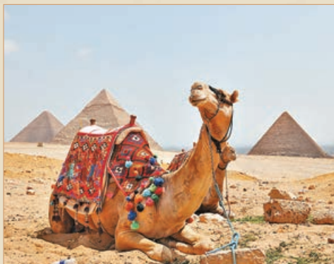
■ 疫情下，埃及吉薩金字塔群景區風光依舊。

受新冠疫情等因素的影響，埃及吉薩金字塔群景區內雖然遊客稀少，但風光依然，不少遊客從埃及開羅拍攝了吉薩金字塔群日落景色。