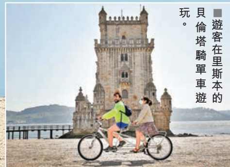
■ 遊客在里斯本的貝倫塔騎單車遊玩。

同時，早前葡萄牙進入疫情解封第二階段，重新開放部分商店、學校、博物館和戶外餐飲服務。當中，為評估進一步解封措施下恢復觀眾現場觀看文化演出的可行性，當地舉行了一場測試演出，參與測試的1,000名觀眾經過新冠病毒檢測確認陰性後，全程佩戴口罩現場觀看表演。