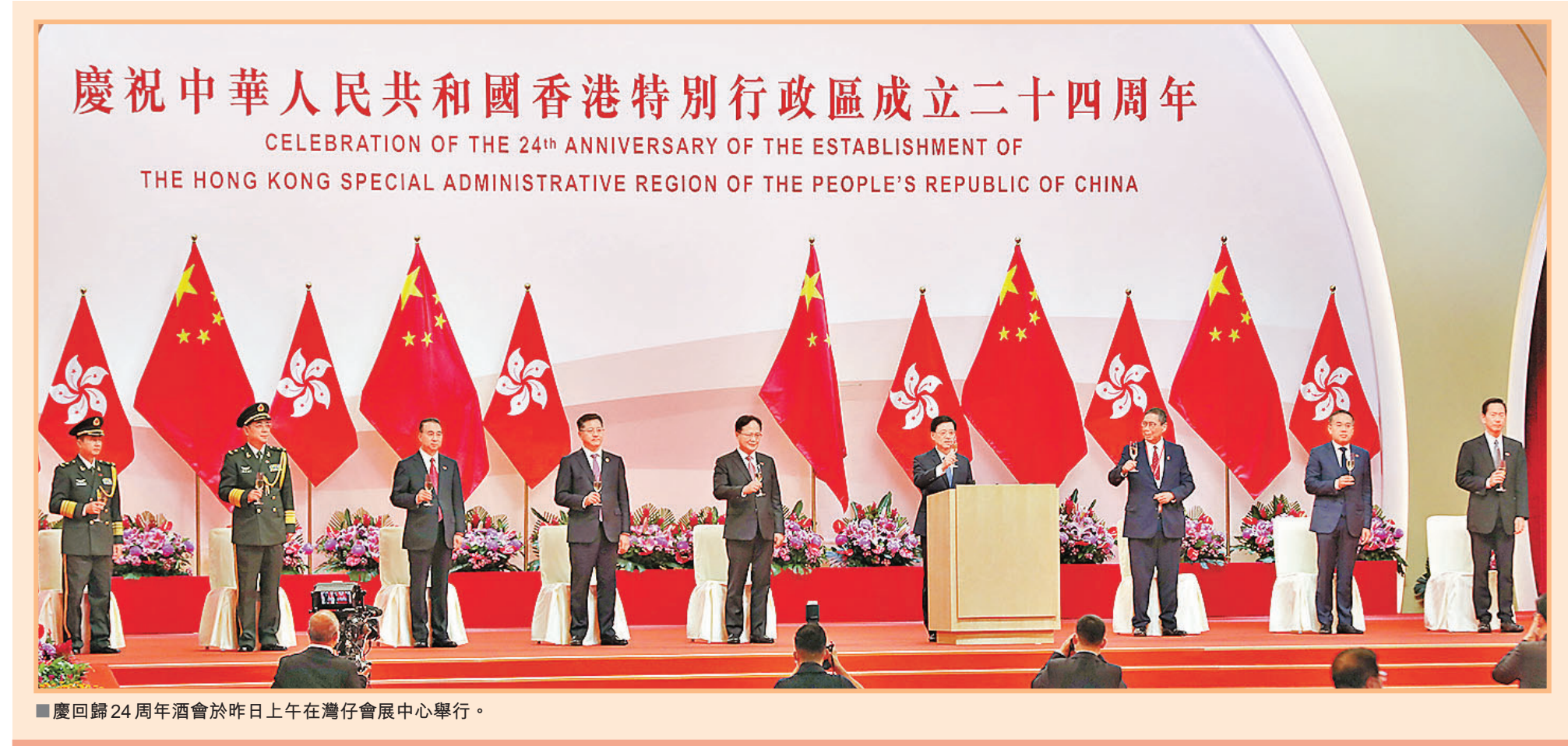
慶回歸24周年酒會於昨日上午在灣仔會展中心舉行。

特區政府昨日舉行升旗儀式和慶祝酒會，慶祝香港回歸祖國24周年，署理行政長官李家超在酒會致辭時表示，每年的七一特區紀念日都讓人自豪地回顧香港回歸祖國懷抱的歷程，堅定重申「一國兩制」是維持香港長期繁榮穩定的最佳制度，並莊重承諾深入推進「一國兩制」的實踐。今年七一亦是慶祝中國共產黨成立100周年的大日子，社會各界應對在中國共產黨領導下，提出及實行的「一國兩制」有更深的體會。中央在一年內先後制定香港國安法及完善特區選舉制度，令社會及政治局面回復穩定，香港絕對有條件從低谷中反彈，成就更美好的未來。