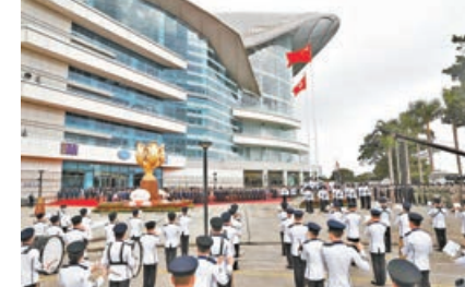
鮮艷的國旗和區旗在金紫荊廣場冉冉升起。

為慶祝中國共產黨百年華誕和香港回歸祖國24周年，各中央駐港機構，包括中聯辦，中央駐港國安公署、外交部駐港特派員公署，解放軍駐港部隊均於昨日上午舉行了莊嚴的升旗儀式，向國家和香港獻上最真摯的祝福。