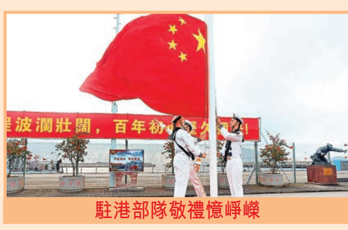
駐港部隊敬禮憶崢嶸

駐港國安公署昨日在灣仔總部門外舉行升旗儀式，慶祝中國共產黨成立100周年和香港回歸祖國24周年。