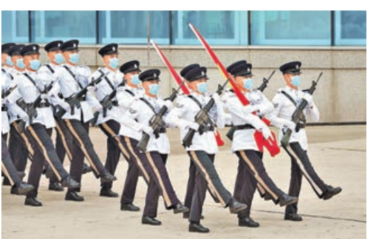
護旗方隊首次以中式步操入場。

特區政府昨日上午在金紫荊廣場舉行升旗儀式，為慶祝香港回歸祖國、特區成立24周年系列活動揭開序幕。香港紀律部隊組成的儀仗隊和護旗隊首次以中式步操邁步進入金紫荊廣場，方隊指揮官亦以普通話鏗鏘有力地喊口令。其後，莊嚴的《義勇軍進行曲》響起，全場嘉賓肅立，在兩名歌唱家領唱下高唱國歌，注視着中華人民共和國國旗及香港特區區旗冉冉升起，氣氛莊重。 政府飛行服務隊直升機亦飛過維多利亞港上空並展示大型國旗和區旗，消防輪及水警輪則在維港海面噴灑水柱敬禮，慶祝香港特區成立24周年。