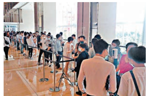
維港1號示範單位處，九龍灣國際交易中心大堂昨日湧現參觀人潮。

該公司表示，今年上半年經營業績大幅改善，較2019年同期也實現較好增長，主要是今年以來全球疫情形勢整體好轉，國際原油價格震盪上行，內地統籌疫情防控和經濟社會發展成果持續鞏固，石油石化產品市場需求較快恢復。