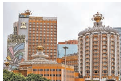
隨著旅客流入，澳門賭場收入日增。

據澳門政府旅遊局數據顯示，澳門5月近92%旅客來自內地，而證券商估計，當中逾58%內地旅客來自廣東省，是澳門最大入境客源。