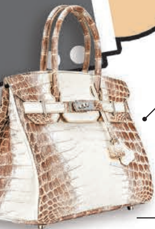
愛馬仕白色啞光尼羅河鱷魚皮30公分喜馬拉雅柏金包配鍍鈹金屬件，估價95萬至120萬港元。