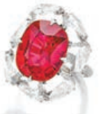
15.45卡天然「馬達加斯加」紅寶石配鑽石戒指，估價700萬至900萬港元。