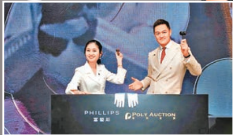
富藝斯和保利拍賣聯乘拍賣會，迭創佳績。