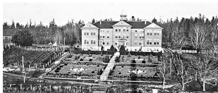
庫珀島寄宿學校是當地原住民的寄宿學校。圖為該校的黑白照片。

據加拿大媒體報道，這所寄宿學校開辦於 1890 年至 1970 年之間，那裏發生過許多恐怖事件。加拿大原住民寄宿學校歷史和對話中心網站顯