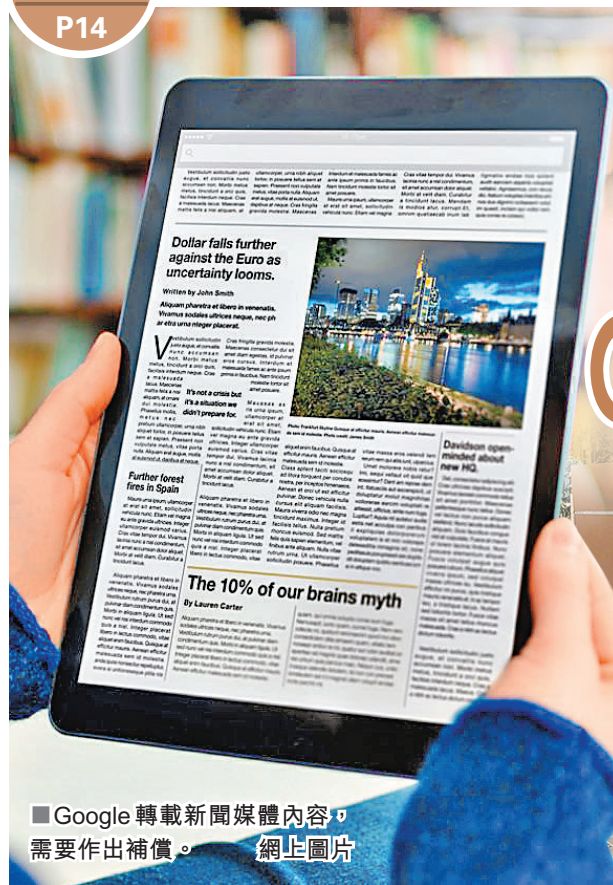
Google 轉載新聞媒體內容，需要作出補償。網上圖片