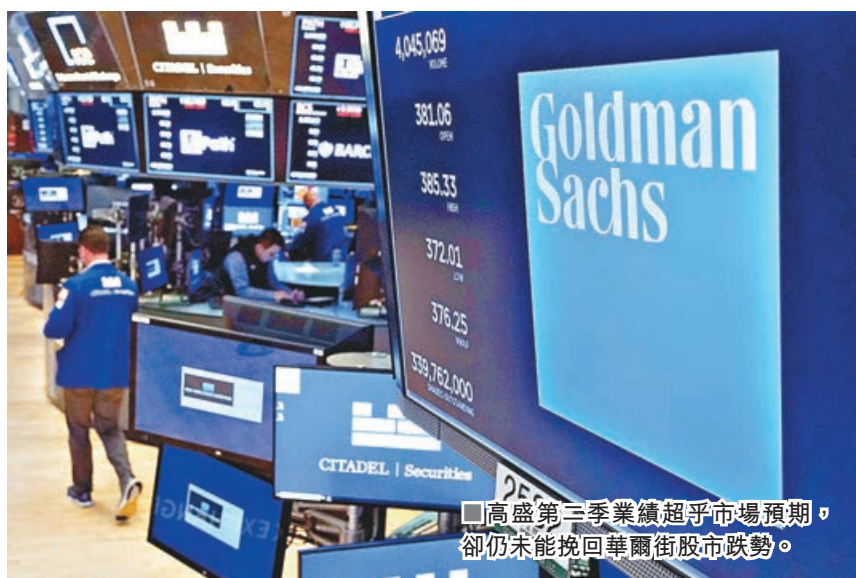
■ 高盛第三季業績超乎市場預期，卻仍未能挽回華爾街股市跌勢。

港股持續反彈了三日後出現回整，恒指跌了170多點，但仍企27,500點的好淡分水線之上，短期有望先穩住的格局暫時未有受到破壞，但是否已扭轉了中期向下的運行趨勢，仍有待進一步觀察驗證，目前宜繼續保持謹慎態度提高警惕性，相信接下來公布的內地宏觀經濟數據會是關注重點，也要密切注視市場的反應。