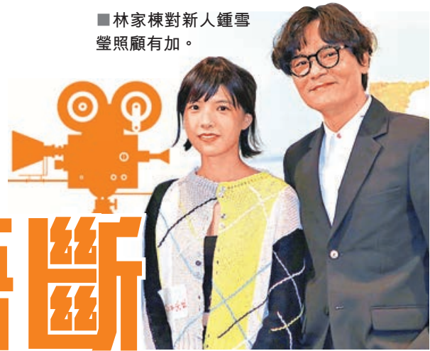
■林家棟對新人鍾雪瑩照顧有加。

謝賢（四哥）、周聰昔日在粵語片年代合作無間，今次在林家棟監製的電影《殺出個黃昏》再結片緣，前晚二人現身首映禮上雞啄唔斷，周聰上台時更開心興奮得險些絆到，幸獲家棟快手扶起，有驚無險，聰叔表現淡定，更大讚四哥永遠都青春美麗，永遠都擁有很多粉絲支持，稱得四哥笑到四萬咁口。