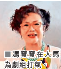
■馮寶寶在大馬為劇組打氣。

謝賢（四哥）、周聰昔日在粵語片年代合作無間，今次在林家棟監製的電影《殺出個黃昏》再結片緣，前晚二人現身首映禮上雞啄唔斷，周聰上台時更開心興奮得險些絆到，幸獲家棟快手扶起，有驚無險，聰叔表現淡定，更大讚四哥永遠都青春美麗，永遠都擁有很多粉絲支持，稱得四哥笑到四萬咁口。