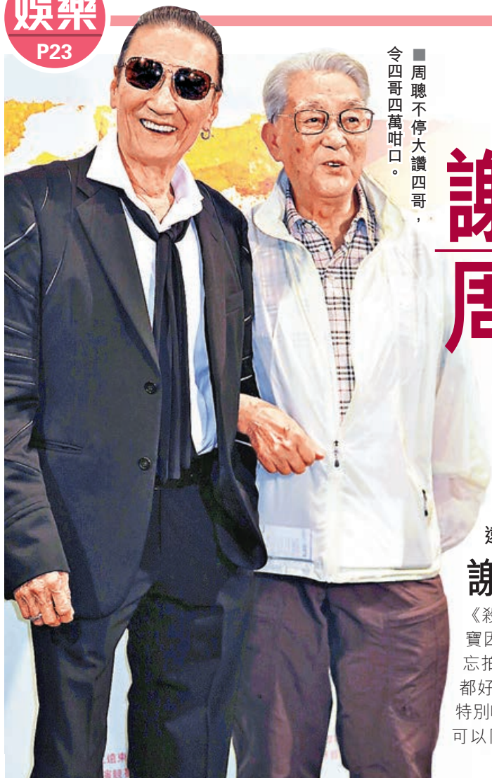
■周聰不停大讚四哥，令四哥四萬咁口。