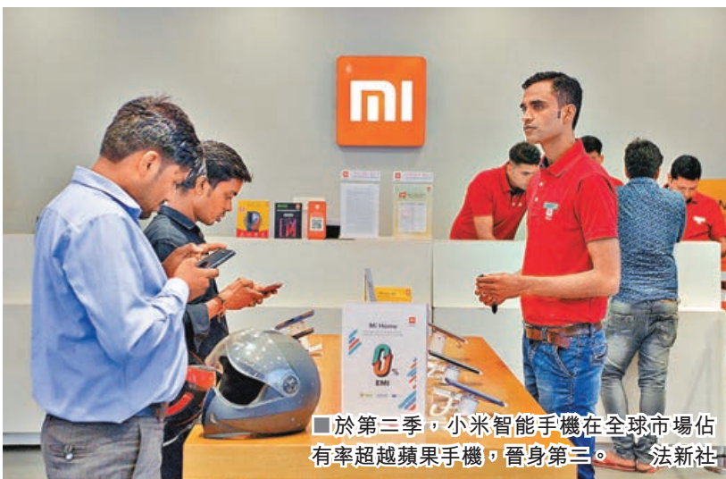
於第三季，小米智能手機在全球市場佔有率超越蘋果手機，晉身第三。

港股上周五仍處於早前指出的先穩住格局狀態，恒指表現反覆整理微漲8點，站到28,000點水平收盤，而27,500點依然是恒指的好淡分水線，宜繼續注視能否守穩其上。目前，大盤的總體動力仍有待增強，尤其是關注到港股通的流量依然未見起色，而市況繼續以個股分化行情發展。