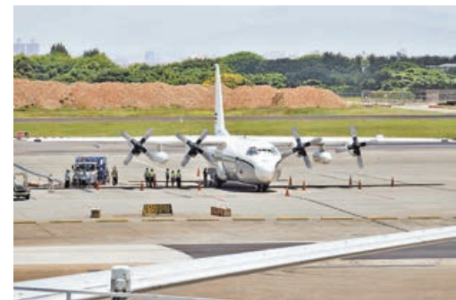
■美軍C-130軍機19日中午降落桃園機場後，地勤人員卸載貨品。

也有民眾質疑「微解封」其實是「偽解封」，不僅造成困擾又無助經濟振興。按照民進黨當局的說法，對消費產業漸進式鬆綁是「因應民眾呼聲」維護民生經濟。有民進黨籍縣市長卻對媒體表示，須設法避免「微解封」造成疫情上升，否則又得關閉場域場所。《中國時報》評論文章一語中的——民進黨當局推出「微解封」政策且允許地方自行調整，意在「甩鍋」縣市和老百姓，一旦出現疫情反彈，既可藉此打擊政治對手，又能說成是老百姓要求解封。島內網友痛批，民進黨當局這波操作充斥政治算計，令人寒心。