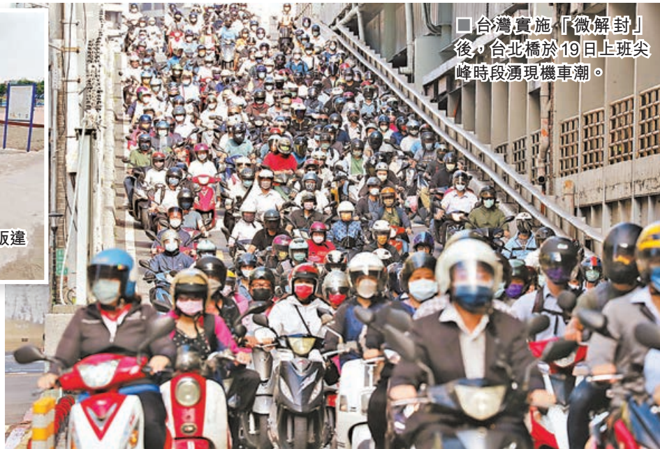
■台灣實施「微解封」後，台北橋於19日上班尖峰時段湧現機車潮。

台灣自5月中旬爆發新冠肺炎疫情以來已蔓延兩月，曾自詡是「防疫模範生」，如今「翻車」跌入疫情泥潭，成抗疫反面教材。在疫情還處於拉鋸階段時，當局為挽救經濟，效仿其他地區急急推出的「微解封」政策漏洞顯見，執行層面也因為當局缺乏清晰指引導致地方「各取所需」，埋下疫情反彈的隱患。