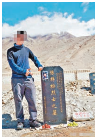
■旅遊博主這個擺拍手勢引發眾怒。

針對有網友曝光有旅遊博主在中印邊境戍邊英雄墓碑旁大擺pose，新疆檢察表示，根據刑法規定，該網友行為涉嫌侵害英雄烈士名譽、榮譽罪，已督促皮山公安局立案。後續，還將以刑事附帶民事公益訴訟手段追究其民事責任。與此同時，今日頭條號已對涉事者賬號予以永久封禁處理。