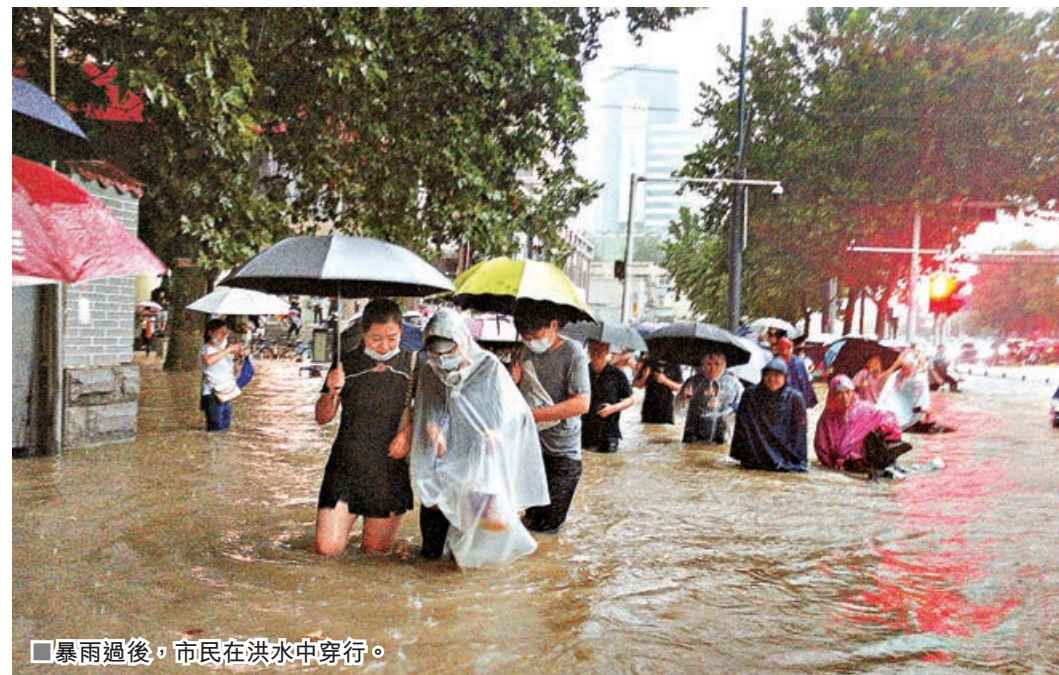
■暴雨過後，市民在洪水中穿行。

針對河南省鄭州市連降暴雨引發險情，應急管理部第一時間啟動消防救援隊伍跨區域增援預案，連夜調派河北、山西、江蘇、安徽、江西、山東、湖北7省消防救援水上救援專業隊伍1800名指戰員、250艘舟艇、7套「龍吸水」大功率排澇車、11套遠程供水系統、1.85萬餘件（套）抗洪搶險救援裝備緊急馳援河南防汛搶險救災。