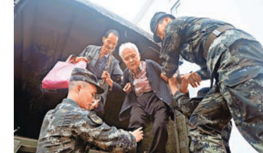
■武警官兵在河南登封告成鎮轉移被困群眾。