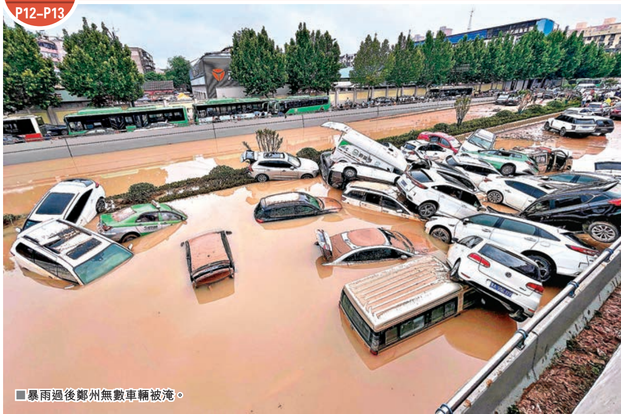
■暴雨過後鄭州無數車輛被淹。