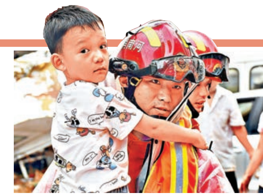
■消防救災人員幫助群眾轉移。