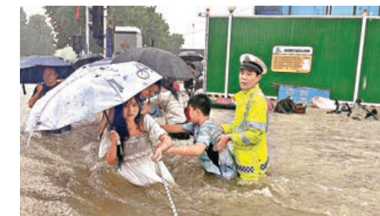
■交警引導民眾渡過被暴雨淹沒的馬路。