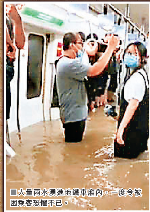
■大量雨水湧進地鐵車廂內，一度令被困乘客恐懼不已。