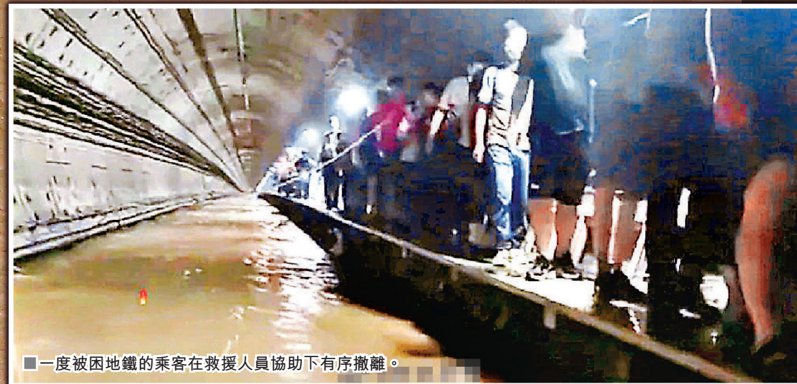
■一度被困地鐵的乘客在救援人員協助下有序撤離。