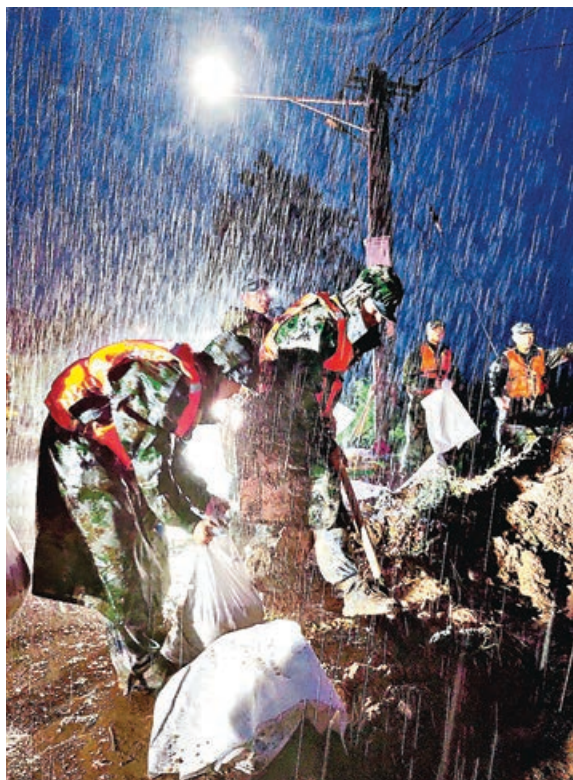
■官兵冒雨在賈魯河祥符區段加固堤壩。

17日以來，河南出現歷史罕見極端強降雨天氣，造成百萬餘人受災。中央氣象台21日晚間再發預警，河南、河北、山西、廣西、海南等地仍有暴雨到大暴雨。針對全國暴雨極端天氣頻發，國家減災委員會專家委員會委員李京表示，完備的應急預案依然是防災救災關鍵所在，加強對民眾防災應災宣傳和應急演練也極為重要。他指出，鄭州洪災當前首先要進行的是救災救人，疏散受災地區人員，然後盡快恢復公共設施和受災地區城市功能的正常運行。