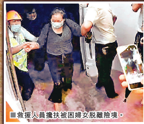
■救援人員攙扶被困婦女脫離險境。