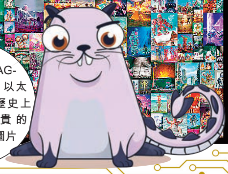
■作品 DRAGON 成交價 600 以太幣，成為 NFT 歷史上成交價格最貴的「貓」。