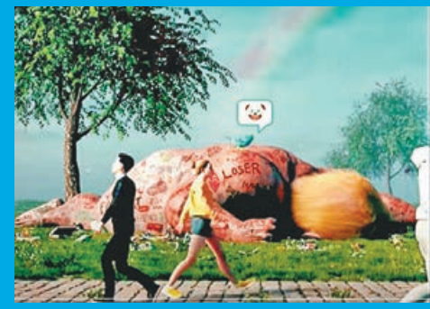
■去年 10 月視頻《十字路口》以 6.6 萬美元售出，幾個月後價格飆升 100 倍至 660 萬美元。

美國藝術家 Beeple 以美國大選為背景，描述幾個行人在一個路口經過，僅長 10 秒