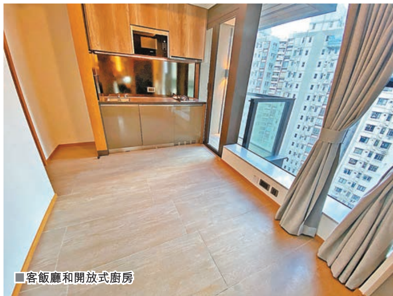
■客飯廳和開放式廚房