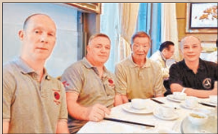
詠春深受外國人喜愛。