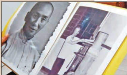
葉問打木人樁舊照。