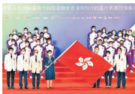
■港隊下月將於陝西參加今屆全運會。

民建聯立法會議員鄭泳舜則表示，這是一個很好的契機，讓香港運動員可進一步提升技術水平，市民也能親身觀賞高水平賽事，更有利營造濃厚的體育氛圍，推