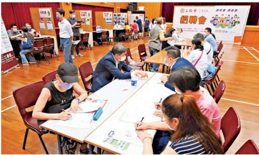
招聘會提供二千多個職位空缺。

本港疫情緩和，失業率回落，連帶飲食業亦出現人手荒。有餐廳慨嘆員工流失率持續偏高，有食品廠則因位置偏遠而一直「有工無人做」，故於昨日參與工聯會舉辦的招聘會希望聘請人手，更分別開出高至1.8萬元及1.9萬元的月薪。不過，本報訪問多名求職市民，他們均對飲食業無興趣，反而希望從事多媒體、銷售、家務助理等工作。