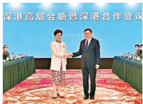
林鄭月娥（左）與王偉中在會議前握手。

行政長官林鄭月娥昨日率領香港特區政府代表團赴深圳，與深圳市委書記王偉中率領的深圳市政府代表團舉行了深港高