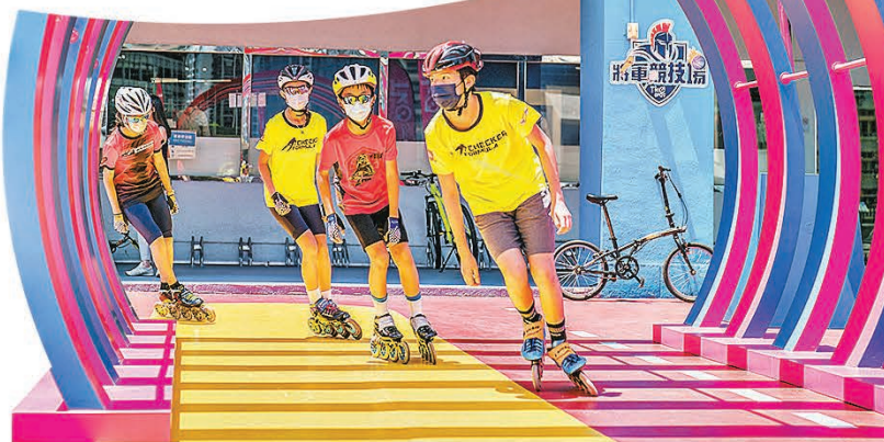
■「車神大道」好啱滾軸溜冰。