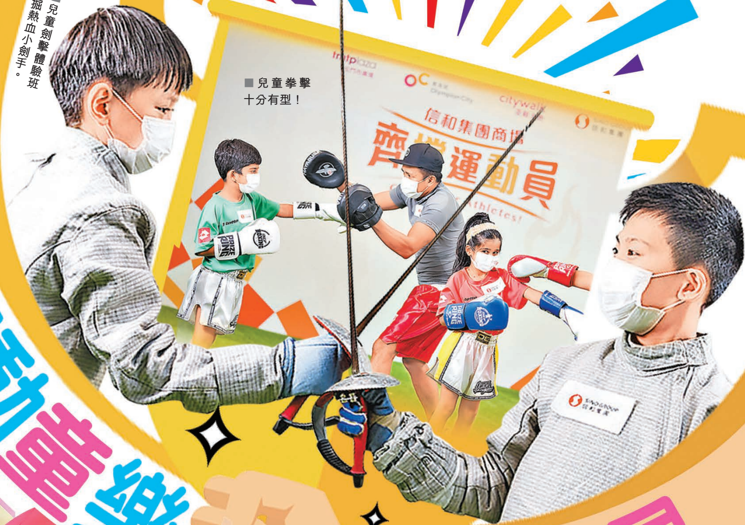
■兒童拳擊十分有型！