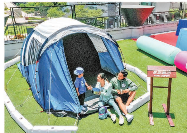
■「營營地」適合親子體驗露營生活。