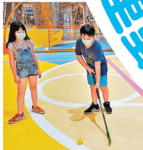
■旱地冰球講求體力與技巧。

港隊早前在東京奧運取得佳績，近期多個商場食住運動熱潮，與不同體育活動機構合作，舉辦一系列適合小朋友參與的運動體驗班，發掘未來運動界健將。其中奧海城就舉辦3×3籃球體驗班，將新增奧運項目帶到香港。愉景新城則聯同前港隊籃球神射手及現役港隊排球明星舉辦球類興趣班，更引入新興運動如地壺球、旱地冰球、健球等，激發小朋友的運動潛能！