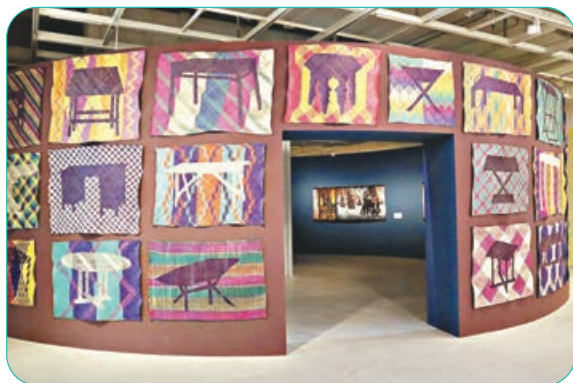
系列織物作品「TIKAR / MEJA」