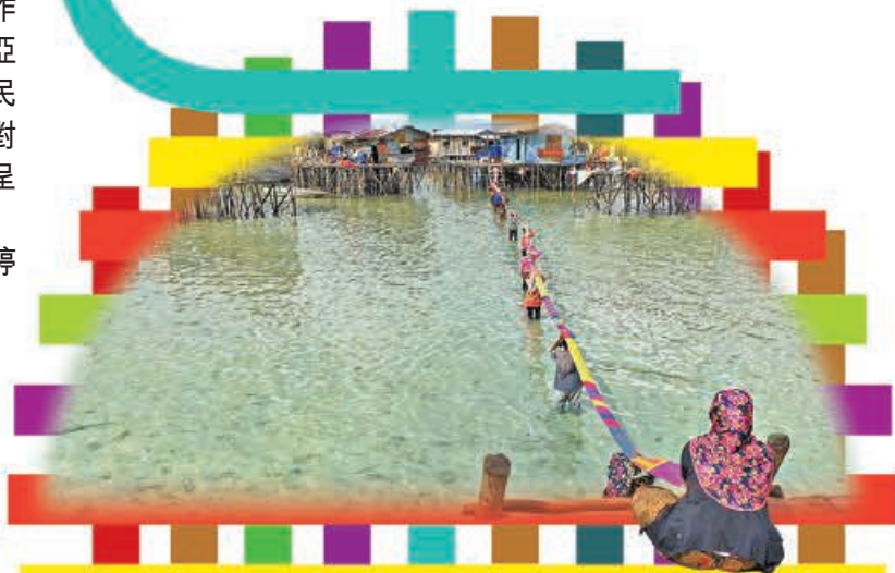
于一蘭本次個展呈現出獨特特色的沙巴文化。