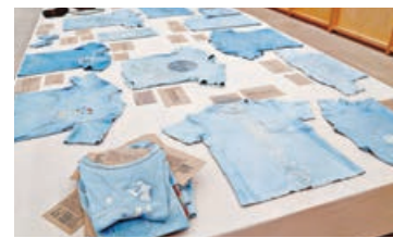
展覽「種學織文」的藍染作品。