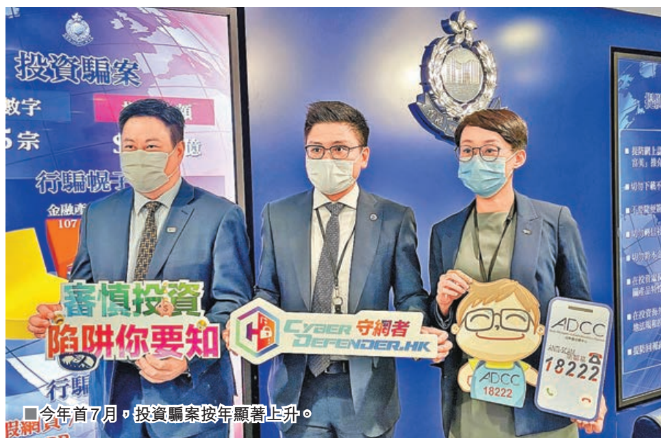
今年首7月，投資騙案按年顯著上升。

年齡最細的網戀投資騙案受害人是17歲的中六學生，在社交媒體與一名自稱由新加坡赴港工作的男子「相戀」，在其建議下在某虛假投資平台，先投資800元購買