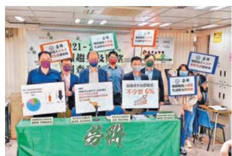
■ 勞聯呼籲僱主與僱員一起分享經濟成果。

訪者 (26%) 認為應根據工作表現決定薪酬，只 7.2% 受訪者認為明年薪金會維持不變，而高達 63.24% 受訪者認為來年會加薪。在考慮合理的薪酬調整因素後，最多受訪者 (34%) 認為明年加薪 4% 至 6% 是合理水平，而平均的合理加薪幅度為 4.95%。