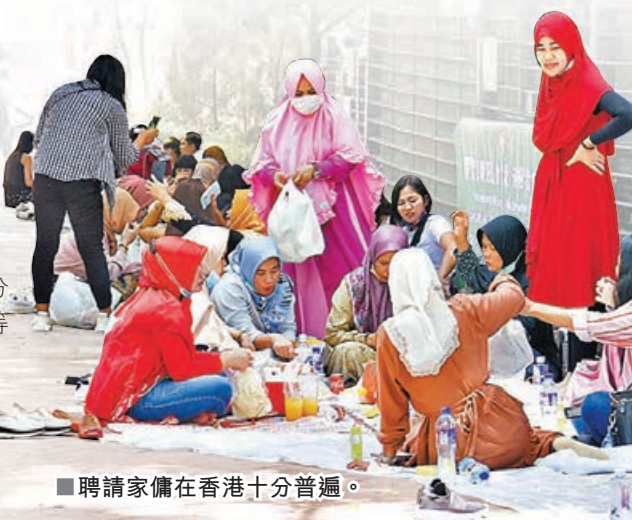
■聘請家傭在香港十分普遍。

另外，家傭保險保單年期一般為一年或兩年，若僱主與原有的家傭提早結束僱傭合約，另新聘一位家傭，一般來說僱主可向保險公司辦理轉名手續，將保單上的受保家傭名字由已完約的家傭轉為新聘家傭。