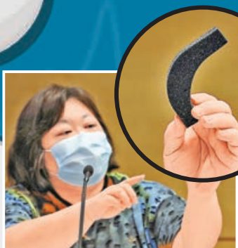
■蘇女士展示有害的隔音泡棉。