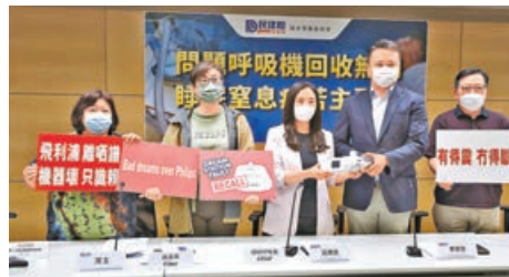
■苦主昨日於記者會反映情況。