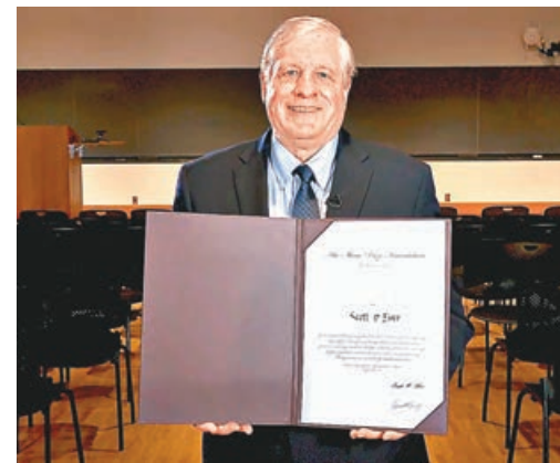
■斯科特·埃姆爾獲得生命科學與醫學獎。