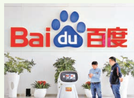
■百度上季營收增一成三，符合預期。

據了解，佳兆業在港共有兩幅地皮，除上述屯門地皮，另一幅為價值約70億元的啟德地皮(50%權益)，亦傳出正尋找買家。