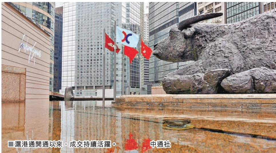
■滬港通開通以來，成交持續活躍。

連接香港和上海股票市場的「滬港通」機制，昨迎來7周年，港交所(0388)表示，期內經過平穩運行，滬、深港通成交持續活躍，屢創新高，並成為中外投資者跨境資產配置主要渠道。滬股通和深股通7年來累計成交額64萬億元人民幣，累計1.5萬億元人民幣淨流入內地股市。在過去7年來，全球資金大幅增加中資股投資配置，由2014年底的865億元人民幣，大增逾29倍，至今年11月10日的2.6萬億元人民幣，同期有2.1萬億元內地資金淨流入港股。