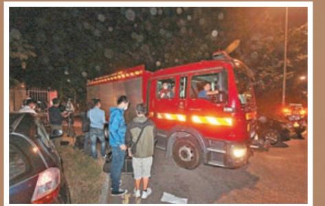
消防趕抵現場搜救。

聚沙井內的污水淤泥，以免積藏的毒氣在工作時釋出，同時可用吹風機將新鮮空氣注入井內，保持空氣流通。 根據《工廠及工業經營（密閉空間）規例》，工人進入沙井工作前應就每個工作步驟進行風險評估；進入沙井時須佩戴設有防墮裝置的安全帶，防墮裝置應牢固繫緊在獨立救生繩上；沙井井口亦必須有守候員候命，與沙井內工人保持聯絡，並保持警覺，一旦發現不尋常，須立即觸動警報器，通知救援隊前來拯救。 另據《職業安全及健康條例》（第509章）第7條，「處所佔用人須確保在該等處所受僱的人安全及健康」，工人落沙井工作而沒有做足安全措施，東主或承建商都要負上責任，一經定罪可判罰款20萬元和監禁1年。