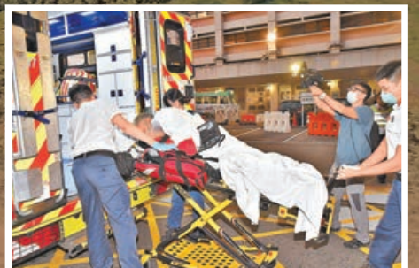
死者丈夫同受傷送院救治。