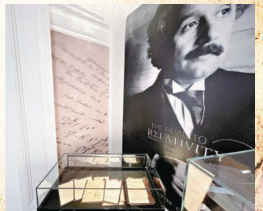
■愛因斯坦手稿，周二在巴黎佳士得拍賣。