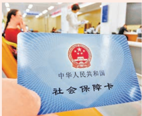
■內地社保包括基本養老、基本醫療、工傷、失業和生育保險5個項目。圖為民眾展示的社會保障卡。

港澳居民到內地就業時，因部分人已在當地參加了社保，因此會有承擔雙重繳費義務的擔憂。深圳社保局25日透露，在深圳市參保的港澳居民，同時在香港、澳門參加當地社會保險，並繼續保留當地社會保險關係的，可憑相關授權機構出具的證明，或本人承諾書申請免繳深圳市養老及失業保險。其中澳門為《澳門特別行政區政府社會保障金受益人供款記錄》，香港為強積金繳存記錄。