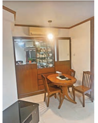
■飯廳放置小餐桌，配以杯碟大櫃。

由長江實業發展的元朗天水圍嘉湖山莊屬全港最大型私人屋苑，合共七期提供單位逾1.5萬伙。當中於1991年入伙的第1期樂湖居鄰近屯馬綫天水圍站及新北江商場，鄰近巴士總站，屋苑內園高度綠化，生活環境優游。