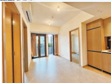
■長方形大廳直達露台和私家花園。