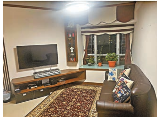
■鑽石形客廳，空間寬敞。