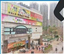
■樂湖居鄰近新北江商場。