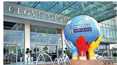
頂級手套指俄烏局勢影響市場情緒,不急於在港上市。

此外,中式餐廳營運商綠茶集團已通過港交所(0388)上市聆訊,外電早前引述消息稱,集團計劃集資1.5億美元(約11.7億港元)。