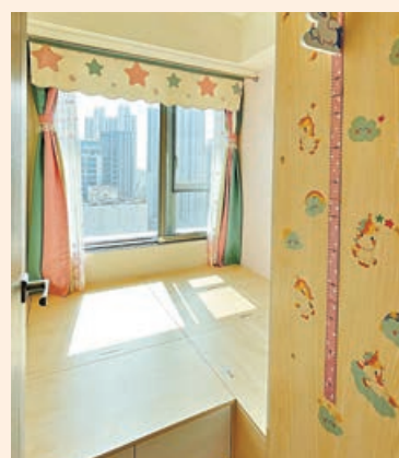
睡房訂製大床，增加收納空間。