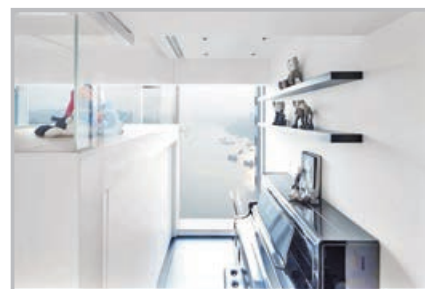
閣樓一角放置一台鋼琴。