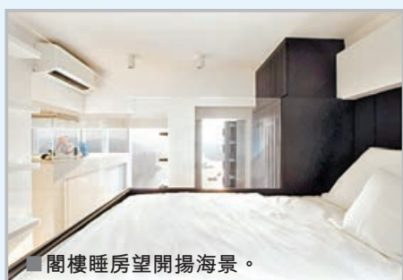
閣樓睡房望開揚海景。