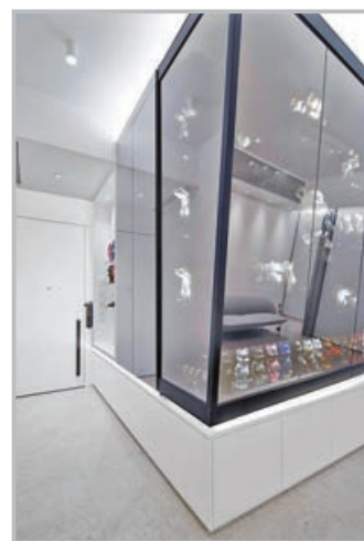
戶主訂製的收藏品玻璃飾櫃。

發展商負責設計及興建13萬呎公眾體育館，運動設施包括四個合共1,600個座位的羽毛球場館，籃球及排球場館及區內首設的兒童遊戲室和戶外運動攀登牆等。