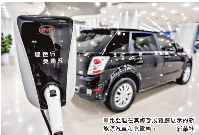
■比亞迪在其總部展覽廳展示的新能源汽車和充電樁。

港股昨日繼續伸延大反彈，恒指再漲了逾1,400點，兩日合計更是達到3,000多點，進一步修復到21,500點水平，差不多已回到本輪拋售的起點。目前，港股急跌下滑後報復式彈升，走勢運行上仍以技術性、情緒性為主，現時宜繼續以這兩方面來觀察研判。