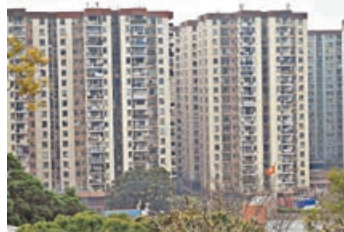
■女事主據報租住美孚新邨。資料圖片

警方表示，今年1月共接獲102宗電話騙案，較去年同期增加19宗，按年升22.8%，損失金額4,300多萬元。在102宗電話騙案中，假冒內地官員及「猜猜我是誰」的電話騙案各佔51宗；但以假冒內地官員的電話騙案最為危險，因犯案過程涉及操控受害人銀行戶口，可致「一鋪清袋」。