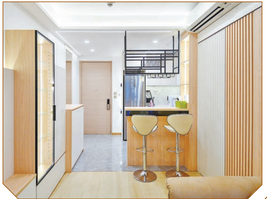
■開放式廚房大變身，加設了一張吧枱，戶主一邊嘆紅酒，一邊用膳。