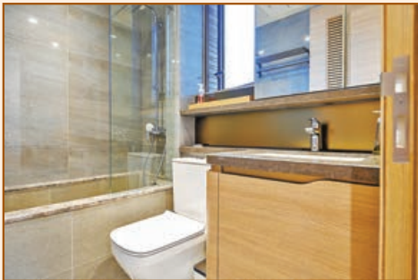
■設計師將浴室內原來的企缸改造成日式浸浴缸。