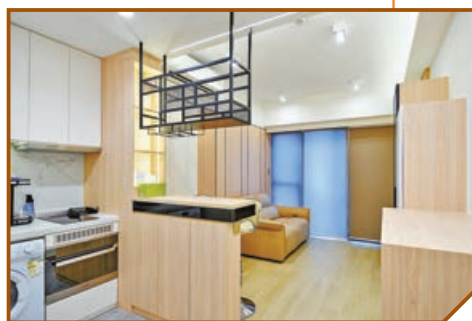
■客飯廳均以木製傢具襯托，牆身也鋪上木條紋裝飾。

今期的裝修單位是位於大埔白石角的住宅嘉熙，業主是一名香港本地騎師。單位實用面積為455呎，居住了業主一家三口和一隻大狼狗，單位原本是開放式廚房設計，但因廚房格局不配合客人的生活習慣，所以設計師Chris今次將原本發展商贈送的廚櫃拆除，重新再造一個廚櫃，還因應客人的要求打造了一張吧枱和放酒的吊架，令單位的空間更為實用，視覺上更開揚。此外，全屋裝修以木質為主，配上白色明亮色調，既簡潔又舒適。