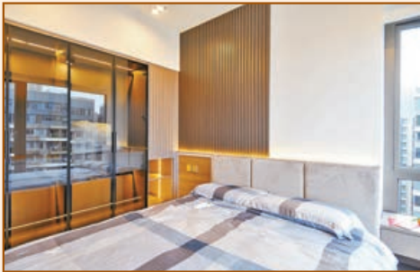
■主人房特製的玻璃大衣櫃。