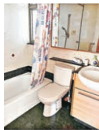
■浴室採用浸浴的浴缸。