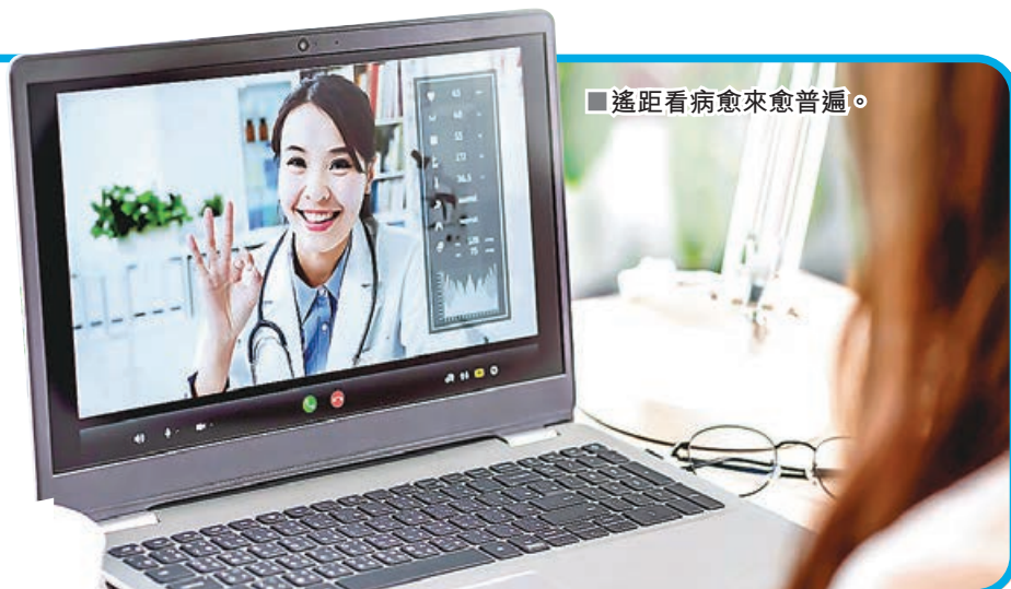
遙距看病愈來愈普遍。

順豐香港擁有龐大的物流網絡及高效可靠的「自營」專業物流配送團隊，確保藥物可準確及快捷地送予病人；再配合嘉里醫藥的藥劑師及品質管理團隊配套作為後盾，藥物最快於4小時內便可安全送到患者手上。