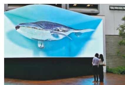
油街實現新藝術的作品

目、康體節目各兩枚印章，就能換領限量版康樂棋紀念品。市民可透過專題網站： https://www.25a-lcsdevents.gov.hk/tc/index.php ，了解活動詳情。